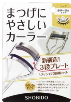
まつげにやさしいカーラー 標準～深めタイプ(リニューアル版)