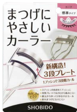
まつげにやさしいカーラー 標準タイプ(新発売)